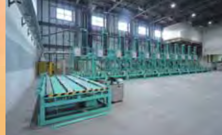
▲規格外品を選別しコンテナへ投入