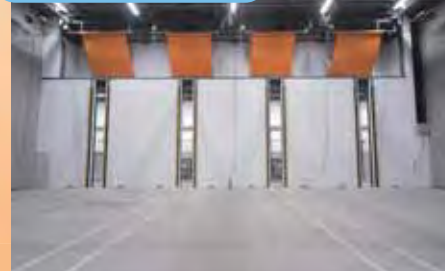
▲温度と湿度を調整し乾燥させる