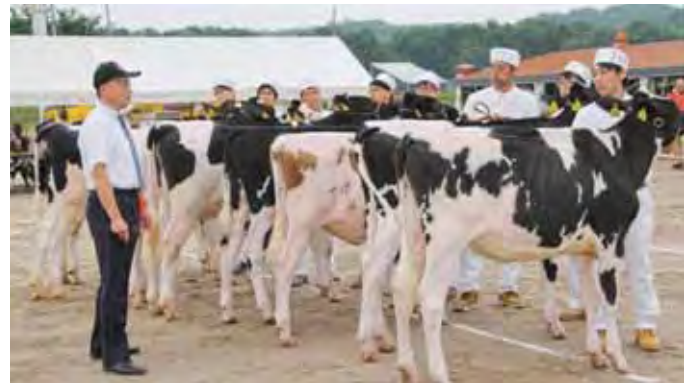
▲昨年の会場の様子

JAきたみらい地域の酪農家の結束を高め、乳用牛の資質向上などを目的として開かれます。ご家族お揃いでご来場されますようお願いしております。