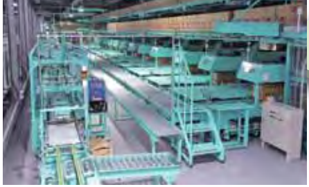
▲指定した重量をダンボールに詰める