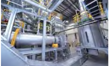
▲玉ねぎの皮を炭化、燃焼させて暖房に利用