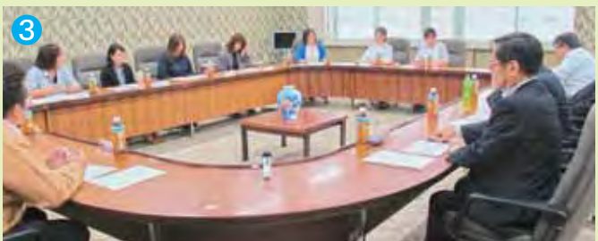
▲熱心な意見交換を交わす三組織(①青年部、②女性部、③フレッシュミズ)のみなさん