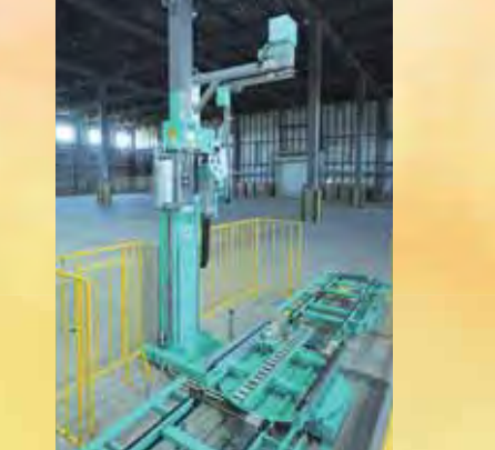
▲荷崩れ防止用のフィルム巻き