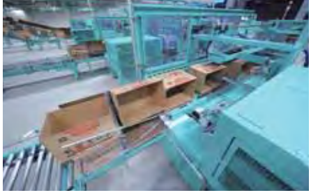
▲自動でダンボールを組み立てる