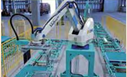
▲ダンボールをパレットに積み上げる