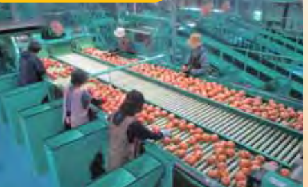
▲形が不揃いなものを選別