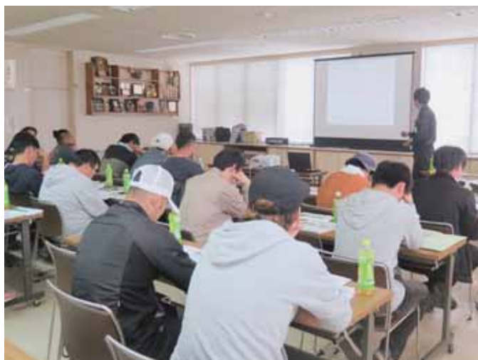
▲熱心に受講する部員のみなさん