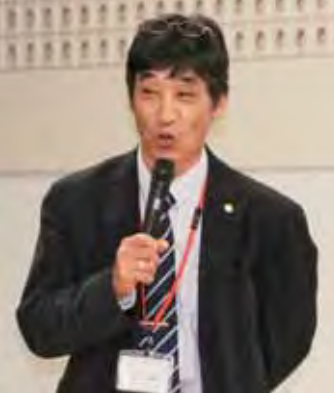
▲新規就農者へエールを送る和崎氏