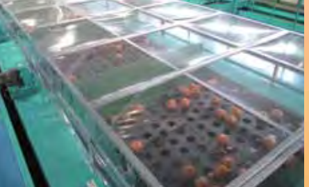
▲規格ごとに仕分け