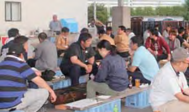
▲焼肉を囲み交流する参加者のみなさん