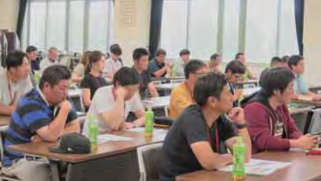
▲講師の言葉に耳を傾ける参加者のみなさん