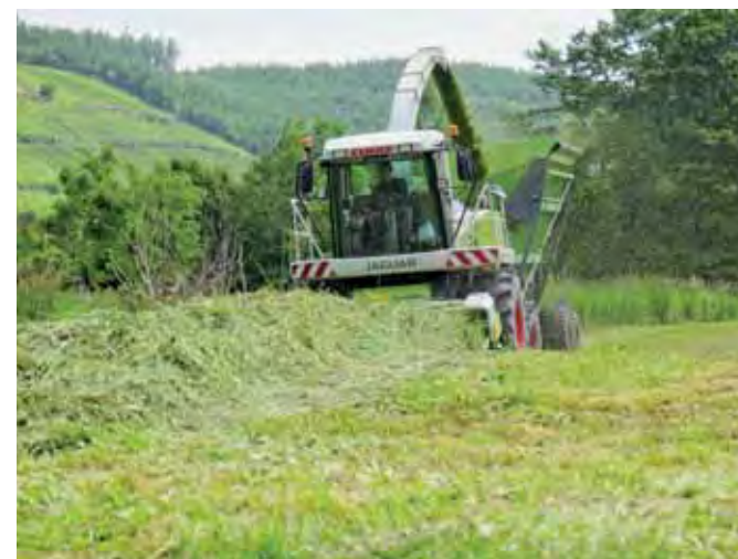
▲一番草の収穫作業風景