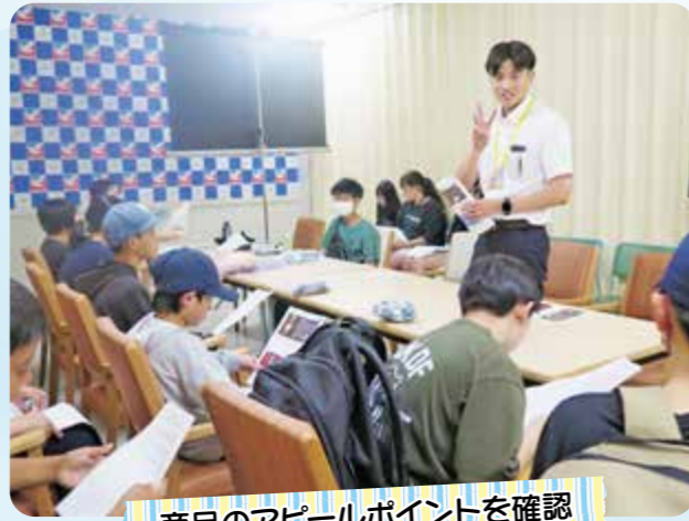
商品のアピールポイントを確認