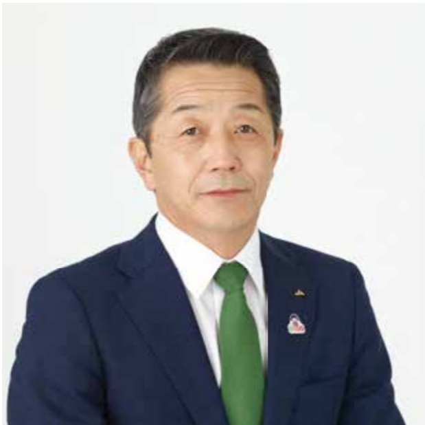
東野ひでき公式LINEアカウントへの登録はこちらから

今後、全国のJAグループの代表として活動いただくために、地元北海道として支援の輪を広げてまいりましょう。