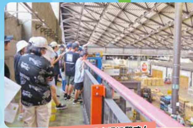
初めて見る市場に驚き!

きたみらい各地区から集まってきたkid'sは、学校もバラバラで初めて会う人がたくさん。ちよっぴの緊張した面持ちでJAセンター事務所に集合し、女満別空港へと向かいました。羽田空港に到着し、最初の研修先「大田市場」へ!到着後、場内見学と作物が消費者に届くまでの流れを学びました。全国各地から運ばれてきた野菜や果実が入った段ボールがずらりと並んでおり、初めて見る光景に目を輝かせていました。