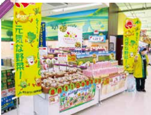
▲▼試食販売会の様子