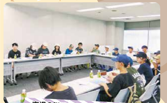
市場の説明を真剣に聞くkid's