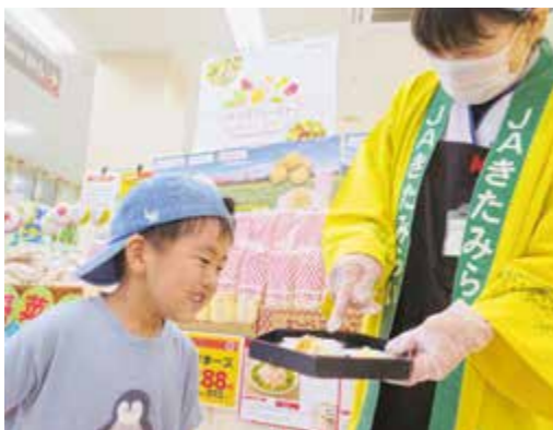
▲▼試食販売会の様子