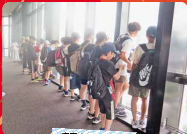
東京の景色に夢中