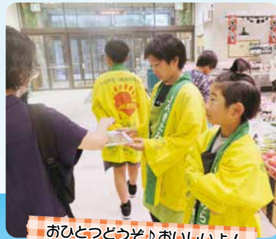
おひとつどうぞ!おいしいよ!