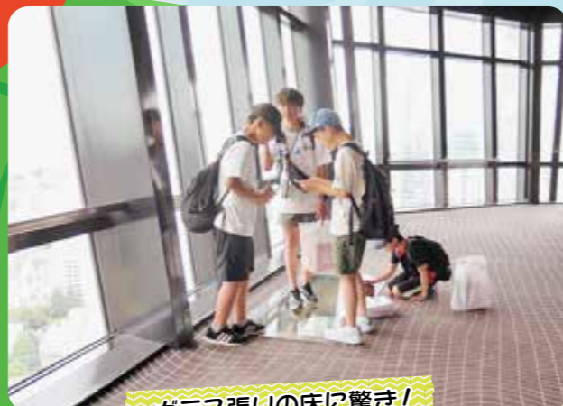
ガラス張りの床に驚き!