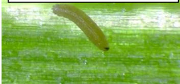
ネギハモグリバエ

10. 農業では害虫によって作物が被害を受けることがあります。 写真の虫はそれぞれ何の作物に害を与えるでしょう？（名前と写真がヒントです）