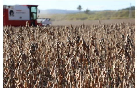
▲大豆の収穫の様子

2. 野菜は栄養が豊富ですが、実は食べ方（調理方法）によってとれる栄養の量に違いが出ます。玉ねぎの栄養を多くとれる食べ方は次のうちどれでしょう？