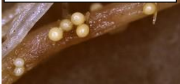
ジャガイモシストセンチュウ