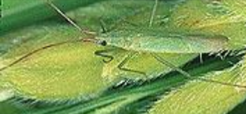
アカヒゲホソミドリカスミカメ